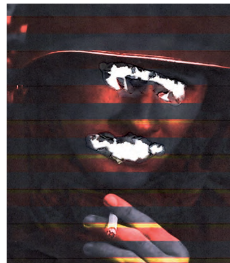
„Schau Soldat! Sprich Soldat!“ Siegerbild von P. Sprenger

Betroffenen bringt, einzufangen. Auch diese Bilder müssen noch dekonstruiert, teils brachial aufgebrochen werden, um zu uns durchzudringen und einen Blick und eine hoffnungsstiftende Reaktion hervorzurufen.