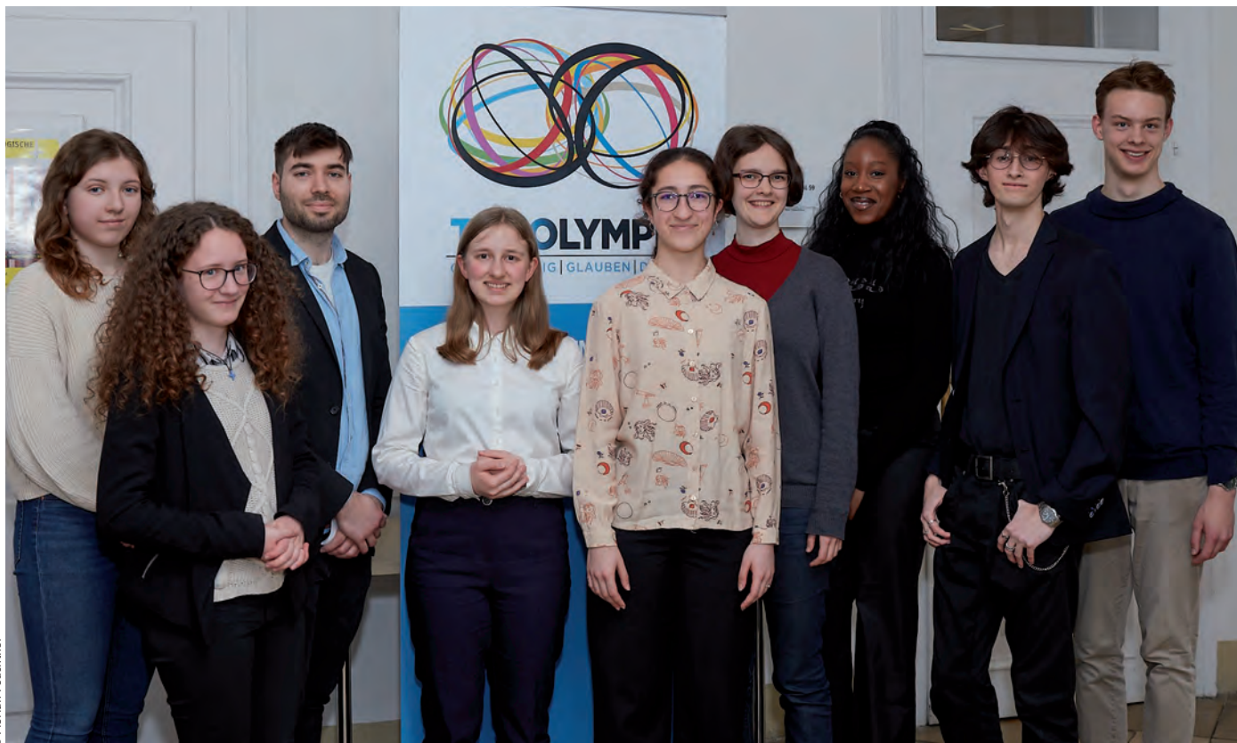
Preisträger:innen und Finalist:innen von Theolympia vor der Lesung und Präsentation ihrer Beiträge

Aufgegeben war den Schüler:innen der Sekundarstufe II, d.h. der Schulstufen 9 - 13 aller höheren Schulen, ein Generalthema, das durch vier impulsgebende Zitate und hinführende Fragen expliziert wird. Nach dem „Verhältnis von Glaube und Vernunft“ im ersten, der existentiellen Frage nach dem Menschen im zweiten Jahr, stand dieses Jahr das Thema Hoffnung im Vordergrund. Als Impulsgeber stand daher unter anderem ein Zitat von Papst Franziskus für das Thema Pate: