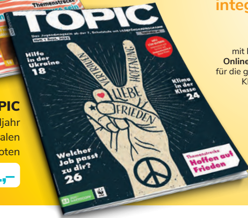
mit Digi-Onlinewelt für die ganze Klasse