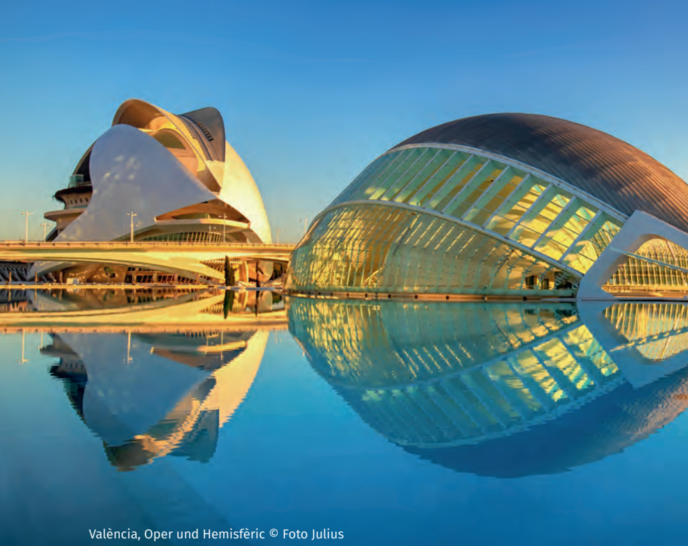
València, Oper und Hemisfèric