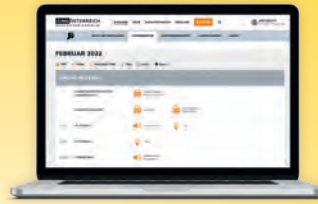
Lehrerservice mit zusätzlichem Arbeits- und Übungsmaterial