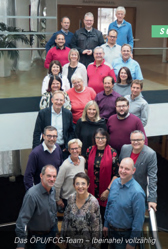
Das ÖPU/FCG-Team – (beinahe) vollzählig