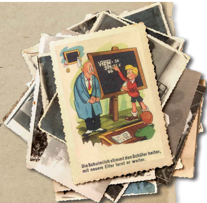
Bild: Schulmilch Werbung in den 60er Jahren

Eingeführt 1930, um die vor allem in den Städten unterernährten Kinder zu unterstützen, erlebte die Schulmilchaktion in den 1970er und 1980er Jahren ihren Höhepunkt. Viele Kinder dieser Zeit erinnern sich sicher noch an die Milchordner, die die Aufgabe hatten, kurz vor der großen Pause vom Schulwart das Milchkisterl für die Klasse zu holen. Bestellt hat man immer für eine Woche und hatte dabei die Auswahl zwischen normaler Milch, Kakao und Vanillemilch. Der 1/4 Liter Milch kostete damals 2 Schilling (0,15€), Kakao und Vanillemilch schlugen mit 2,50 Schilling (0,18€) zu Buche. 1989 wurden in Österreich noch 23 Millionen Liter Schulmilchprodukte getrunken, doch im Laufe der folgenden Jahrzehnte verlor die Schulmilchaktion ihre Bedeutung: Die finanzielle Unterstützung fiel weg und Milch büßte ihre Beliebtheit ein. Heute gibt es noch vor allem für den Primarstufenbereich regionale bäuerliche Schulmilchlieferanten, aber die große Zeit der Schulmilchaktion ist vorbei. Die Schulmilchaktion ist nun Geschichte, aber sie hat Geschichte geschrieben: Wer von den Älteren erinnert sich nicht an im Bankfach versteckte Milchpackerln, die dann an heißen Tagen bald einmal fürchterlich zu stinken begonnen haben?